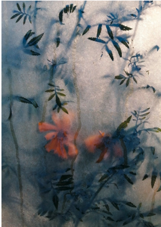
Greenhouse, plant meets plastic