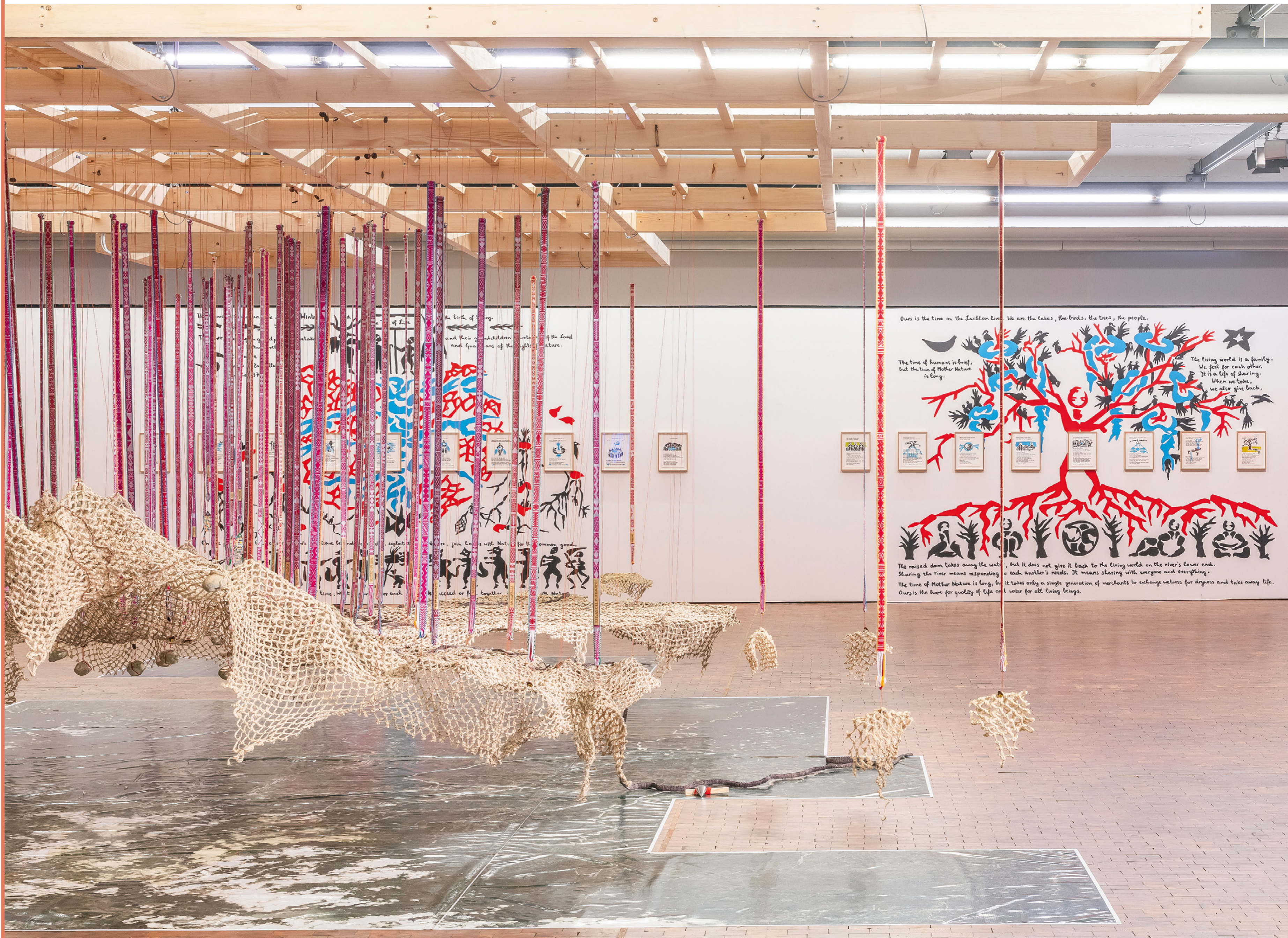
The Great Repair, Ausstellungsansicht, Vordergrund: Inga People of Columbia, Awaska Alpa_woven territory, 2023. Hintergrund: Marjetica Potrč, The Time on the Lachlan River, 2022.